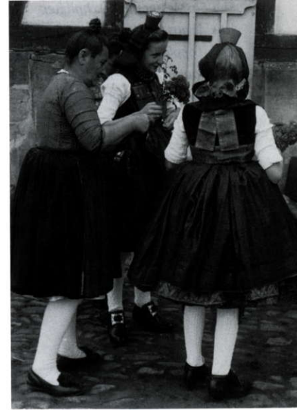
Abb. 4: Andreas Scheller, „Tanz-Vorbereitung“ in der hessischen Schwalm, um 1950, Rautenstrauch-Joest-Museum, Historisches Fotoarchiv, o. Inv.-Nr.