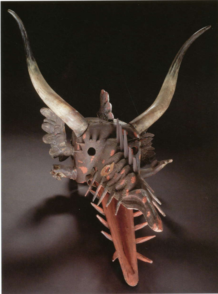
Abb. 2: Diese imposante Perchtenmaske war eine der Hauptattraktionen der Kölner Europa-Sammlung, die 1937 im Tausch an das Berliner Museum für Völkerkunde gelangte. Salzburger Land, 18. Jahrhundert, Holz bemalt, Horn, Leder, Filz, Glas, H. 35 cm, Geweihbreite 69 cm, Staatliche Museen zu Berlin – Preußischer Kulturbesitz, Museum Europäischer Kulturen, Inv.-Nr. 31 M 113.

stellt eine noch näher zu betrachtende Tauschaktion Wilhelm Schellers dar, der 1937 in seiner Funktion als kommissarischer Leiter des Museums die Europa-Sammlung nahezu vollständig an das Berliner Museum für Völkerkunde abgab und hierfür im Gegenzug 338 Objekte aus Afrika, Altamerika und Ozeanien erhielt (Abb. 2 und 3a–b). Mit Ausnahme einer kleinen Lappland-Kollektion wiesen die danach verbliebenen Europa-Objekte keinerlei Kohärenz mehr im Sinne ethnographischer Repräsentanz auf. Das Bestreben des Museumsdirektors Martin Heydrich, die Europa-Sammlung neu aufzubauen, war besonders in den frühen Jahren seiner Amtszeit (1940–60) von der Blut-und-Boden-Ideologie der Nationalsozialisten bestimmt. Auf ihn geht etwa der Erwerb einer Anzahl von Objekten aus der hessischen Schwalm zurück (Abb. 4 und 5), die von der Behar-