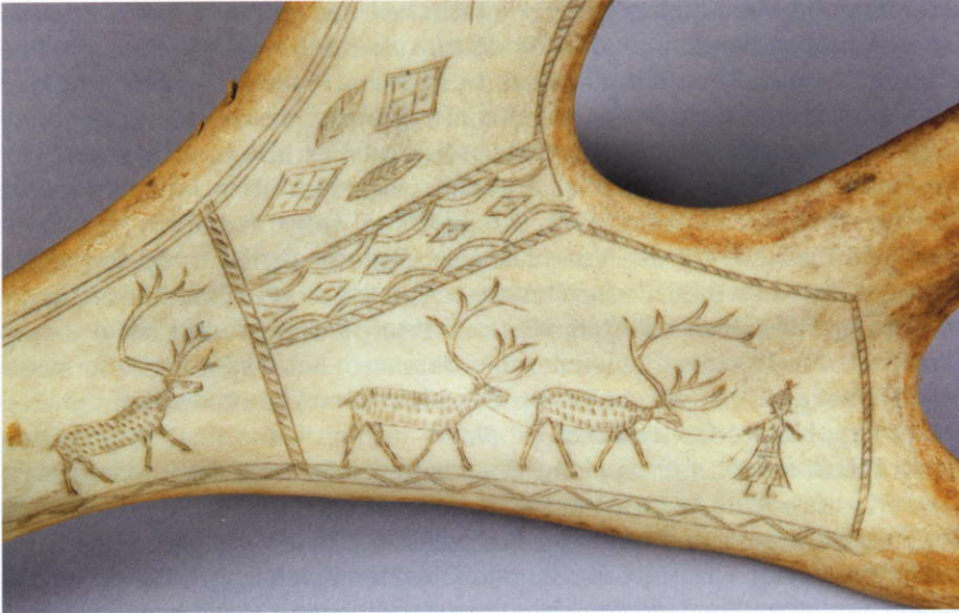
Abb. 6b: Vergrößerung der Ritzzeichnung auf Objekt Nr. 38112 von Abb. 6a.

zu berücksichtigen. Die folgende Argumentationskette, entnommen Foy's programmatischem Aufsatz von 1909, belegt dies nachdrücklich: