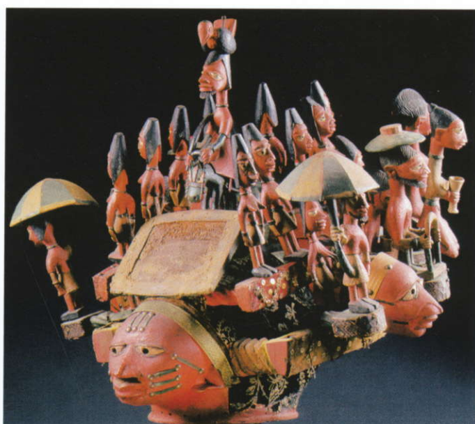
Abb. 3a–b: Tanzaufsatz magbo. Yoruba, Nigeria, vor 1898, bemaltes Holz, Samt, Textilband, Pailletten, Polsternägel, T. 68 cm. Tausch 1937 vom Museum für Völkerkunde, Berlin an das Rautenstrauch-Joest-Museum, Inv.-Nr. 40546.

rung deutschen Kulturguts im Bauernstande als vermeintlich ultimativem Kulturträger zeugen sollten. Mit Recht wandten sich Heydrichs Nachfolger von einer solchen nationalen „Bauernvolkskunde“ ab, so dass nach 1958 nur mehr ein Objekt europäischer Provenienz ins Haus gelangte 5 . Versuche, an frühere Traditionen anzuknüpfen, blieben auf eine unter der Ägide von Gisela Völger 1983/84 ausgerichtete Ausstellung Das Land Appenzell beschränkt 6 .