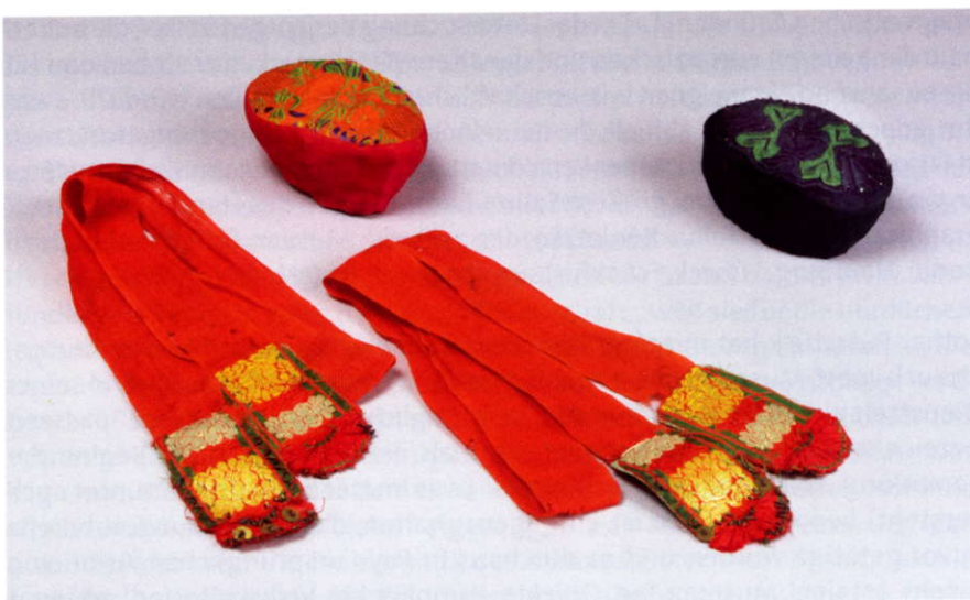
Abb. 5: Frisurhäubchen (vgl. Abb. 4) und Strumpfbänder als Bestandteile der Schwälmer Tracht, Rautenstrauch-Joest-Museum, Inv.-Nrn. 46070, 46075 und 46078.