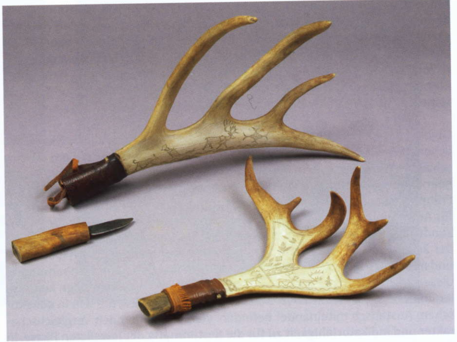
Abb. 6a: Messer mit beschnitzter Scheide aus Rentiergeweih, Schwedisch-Lappland, frühes 20. Jahrhundert, Rautenstrauch-Joest-Museum, Inv.-Nrn. 12374 und 38112.

gen regionalen Einflüsse hierauf zu bestimmen und die wechselseitige Beeinflussung der Kulturen zu untersuchen. Neben geographischen waren dabei auch zeitliche Parameter zu berücksichtigen 10 .